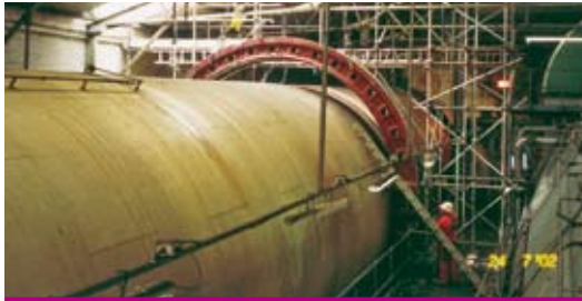
Fourniture et remplacement du bandage sortie d'une diffusion RT

Après expertise, réparation d'un panier d'essoreuse discontinue