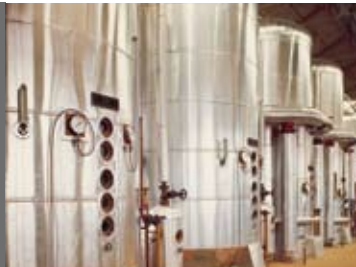
Station d'évaporateurs à grimpage - ITALIE