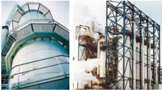
Evaporateur à flot tombant, conception betterave 7 540 m 2