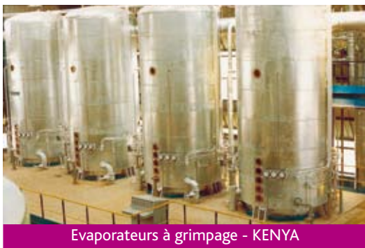
Evaporateurs à grimpage - KENYA