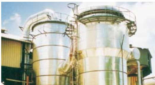
Evaporateur à grimpage Fives Fletcher de type Kestner, 4000 m 2 - GUADELOUPE