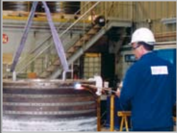
Ремонт контейнера центрифуги периодического действия после проверки