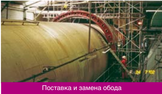
Поставка и замена обода