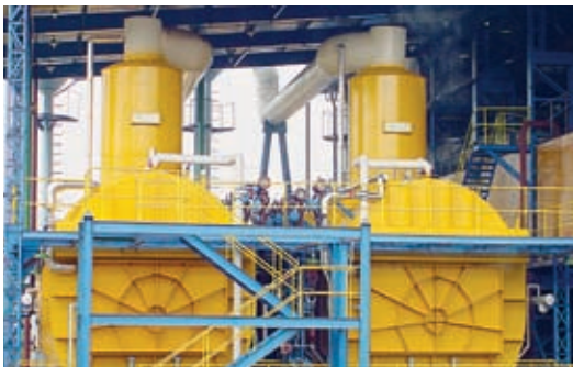
2 tachos Fives Cail CCTW - BRASIL