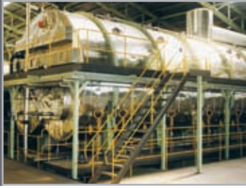
Tacho continuo Fives Fletcher – Tongaat Hulett FF-TH, 140m 3 - INDONESIA