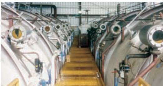
2 tachos Fives Fletcher– Tongaat Hulett FF-TH, 180 m 3 - Luisiana, ESTADOS UNIDOS