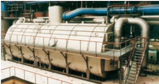
Tacho continuo Fives Fletcher – Tongaat Hulett FF-TH, 115 m 3 - ALEMANIA